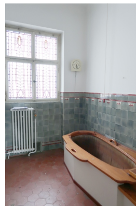
Badehaus 2 Badezelle