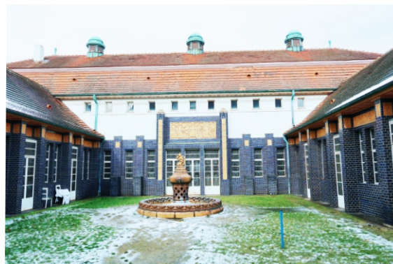
Badehaus 2 Innenhof

2024 (Bauphysik) Abschluss LPH 5 gem HOAI (2023)