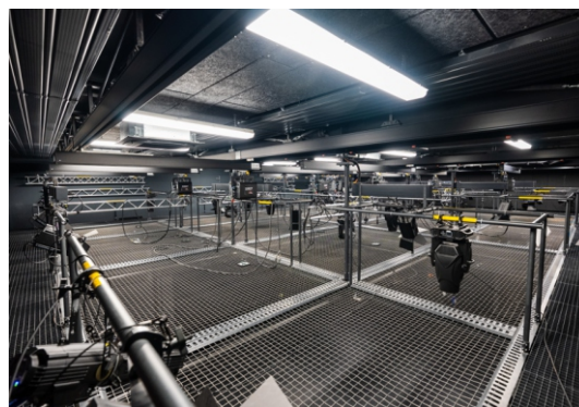
Tension Grid mit Bühnentechnik