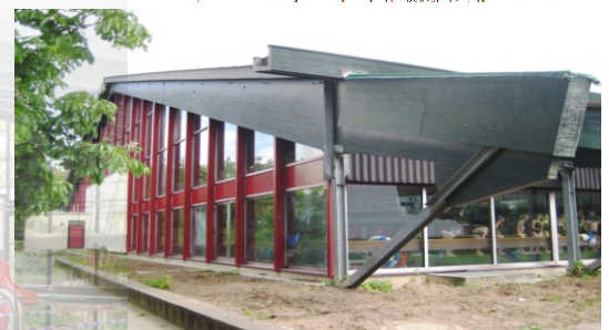
Gebäude vor der Sanierung