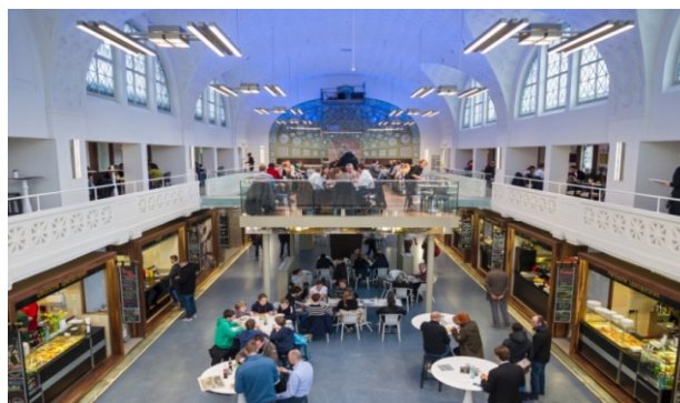
Herrenbad nach Umbau mit neuer Nutzung als Markthalle