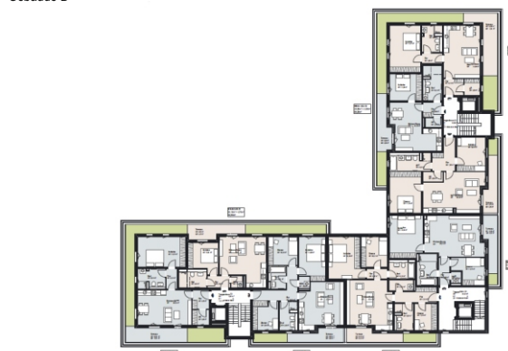
Grundriss Gebäude B