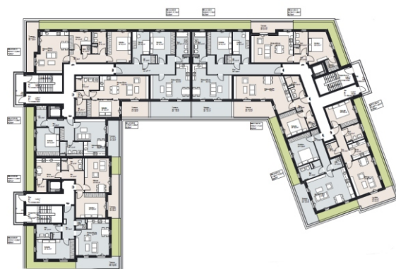
Grundriss Gebäude A