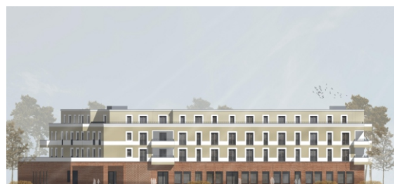
Gebäude A, im OG mit Wohneinheiten und im EG mit Gewerbeflächen