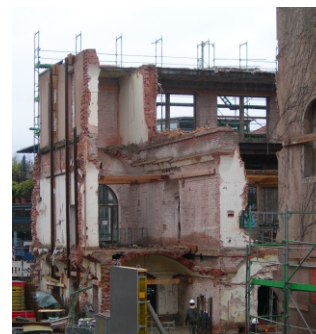
Abstützung von Mauerwerkswänden im Bauzustand (innenseitig und außenseitig)