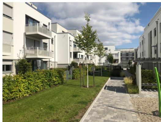
© NHW / KISSLER EFFGEN + Partner Architekten BDA