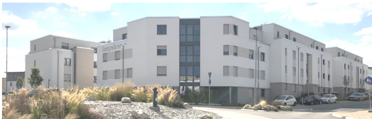
© NHW / KISSLER EFFGEN + Partner Architekten BDA

Fotos / Darstellungen: ZPP INGENIEURE AG, KISSLER EFFGEN + Partner Architekten BDA