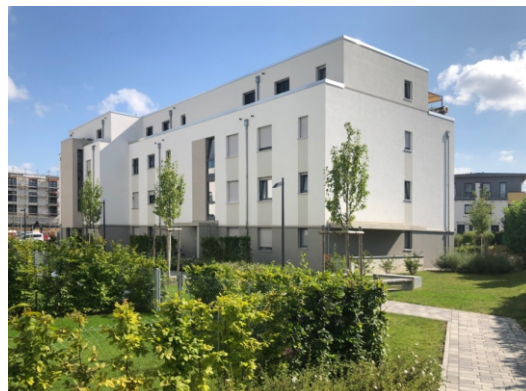
© NHW / KISSLER EFFGEN + Partner Architekten BDA